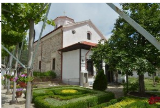
Калоферски манастир "Въведение Богородично"

Пенсиониран от преподавателската практика, през 1908 година свети Нектарий се оттегля на остров Егина, където основава манастир с храм "Света Троица". В строежа на манастира той участва рамо до рамо със строителите.